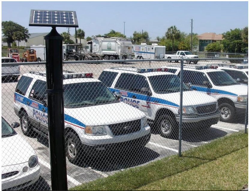
Flota de mantenimiento de la ciudad de Homestead