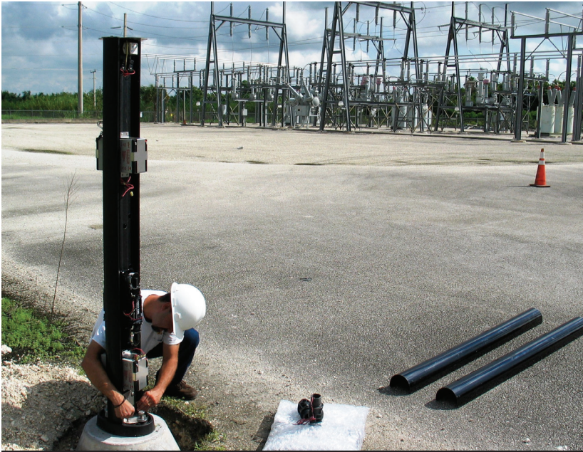
Instalacion subestacion de la ciudad de Homestead